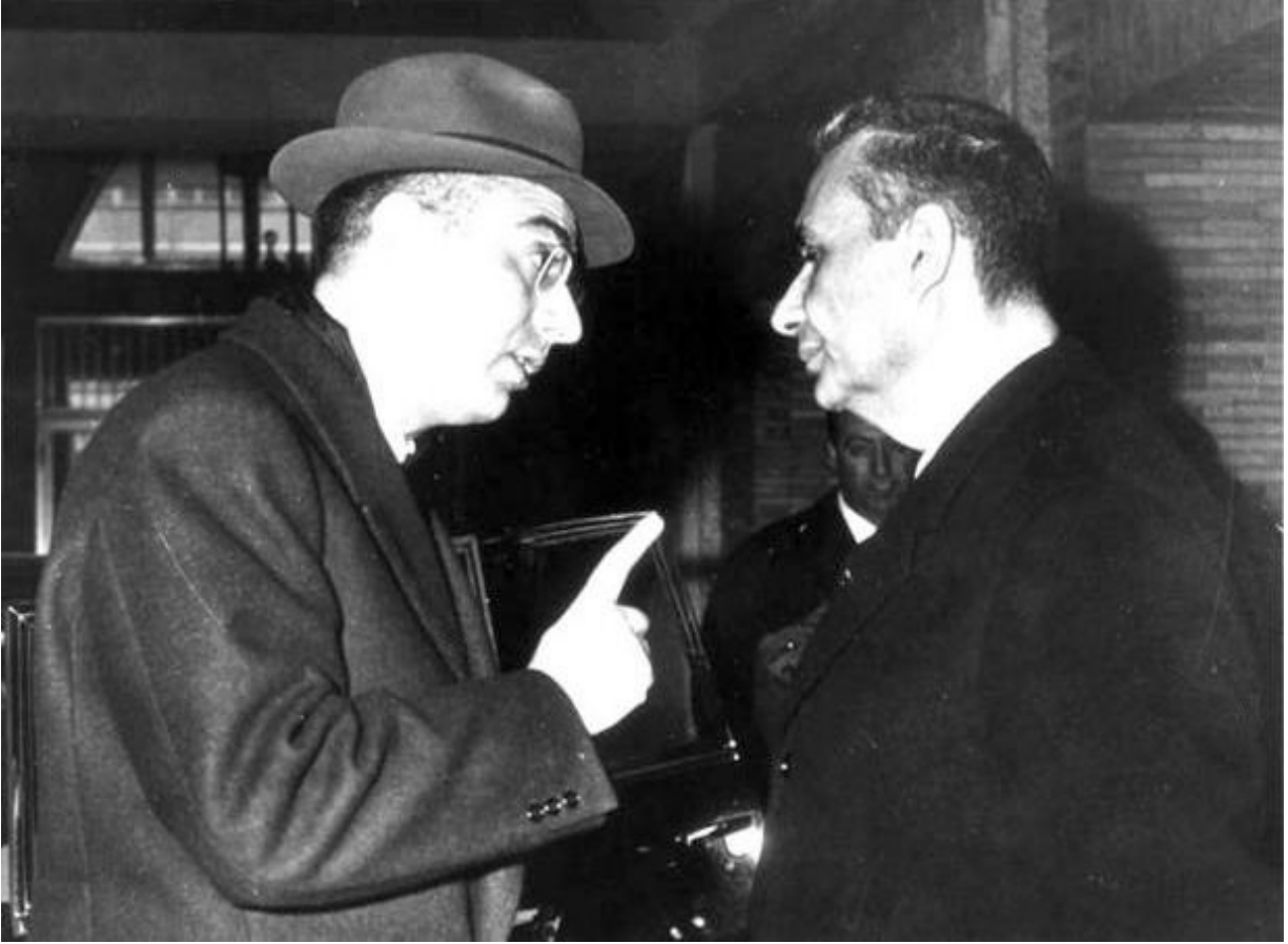
21. Aldo Moro, vittima delle Brigate Rosse, e Francesco Cossiga.