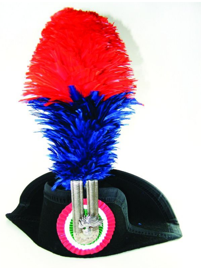
18. La «lucerna», berretto tradizionale dei carabinieri.