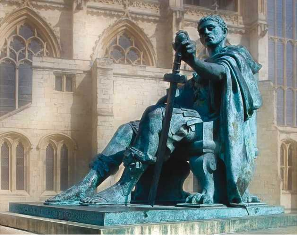
6. Statua di Costantino a York (GB). Sciolse i pretoriani nel 313 d.C.