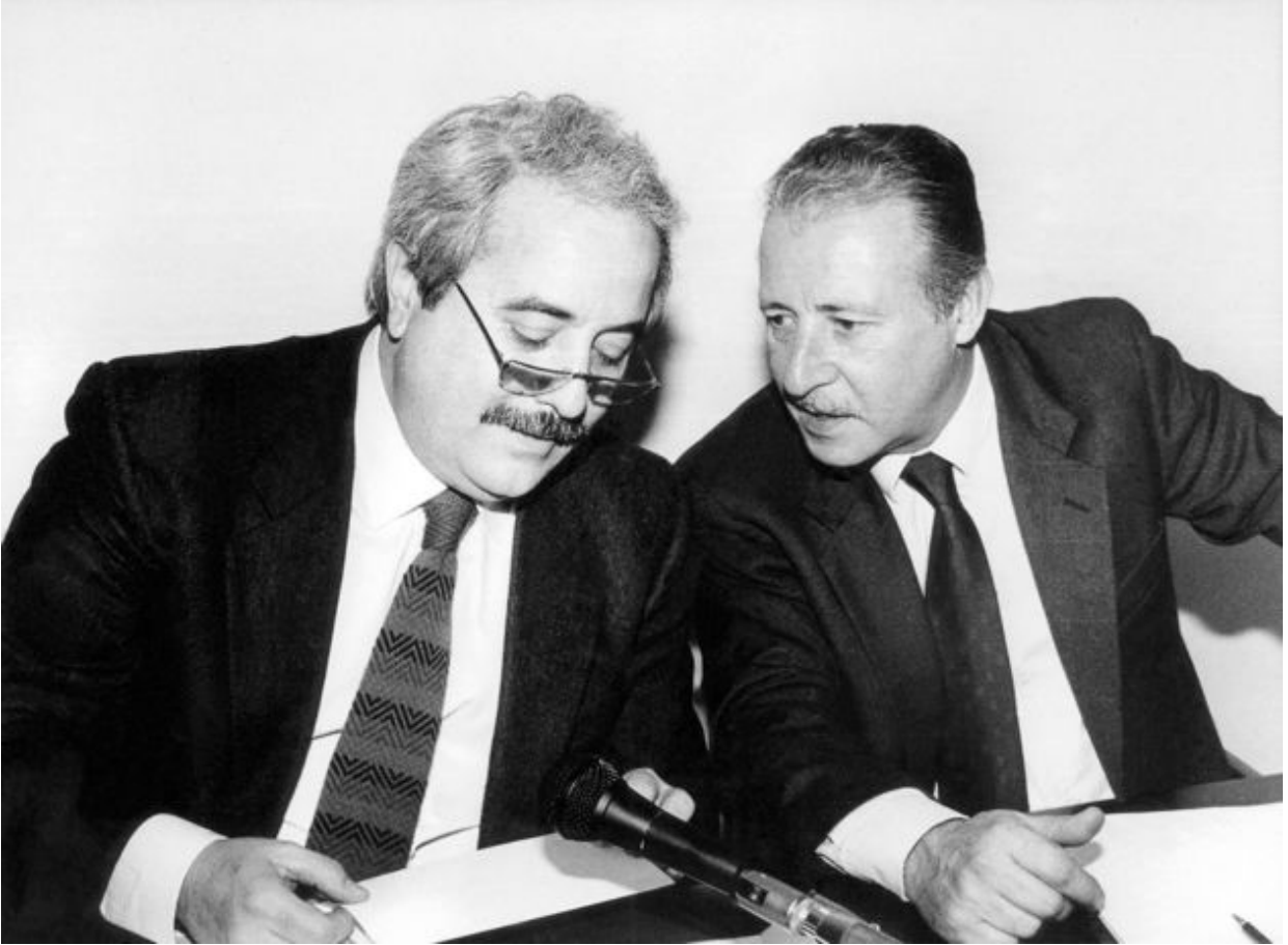
22. I giudici Falcone e Borsellino, vittime di mafia.