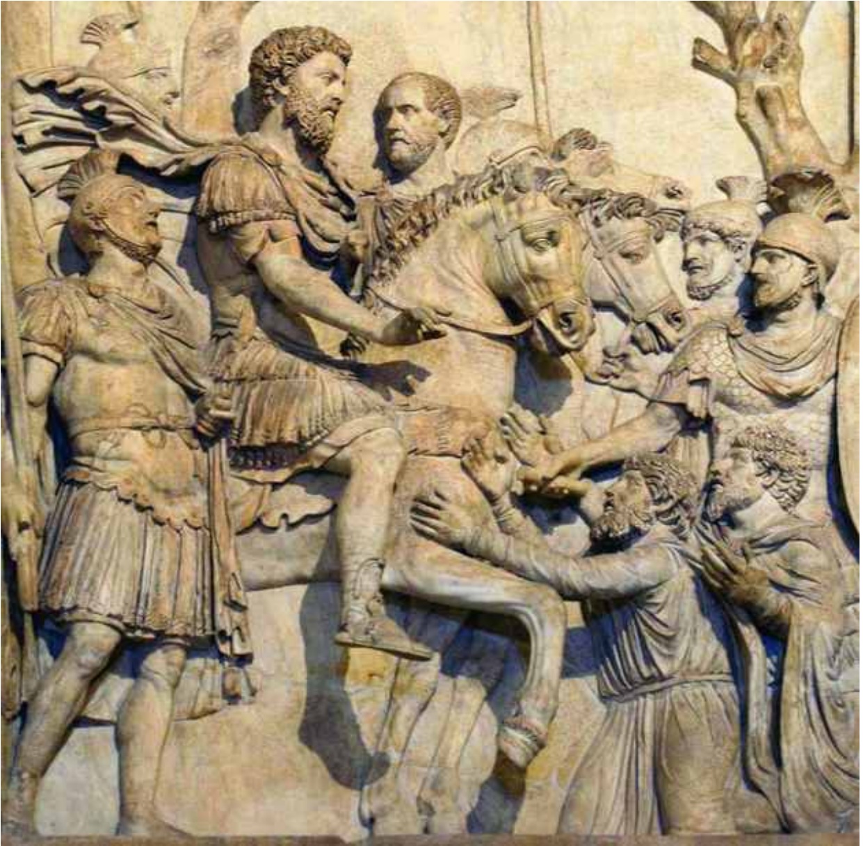
4. Pretoriani al fianco di Marco Aurelio che assoggetta i germani (Musei Capitolini).