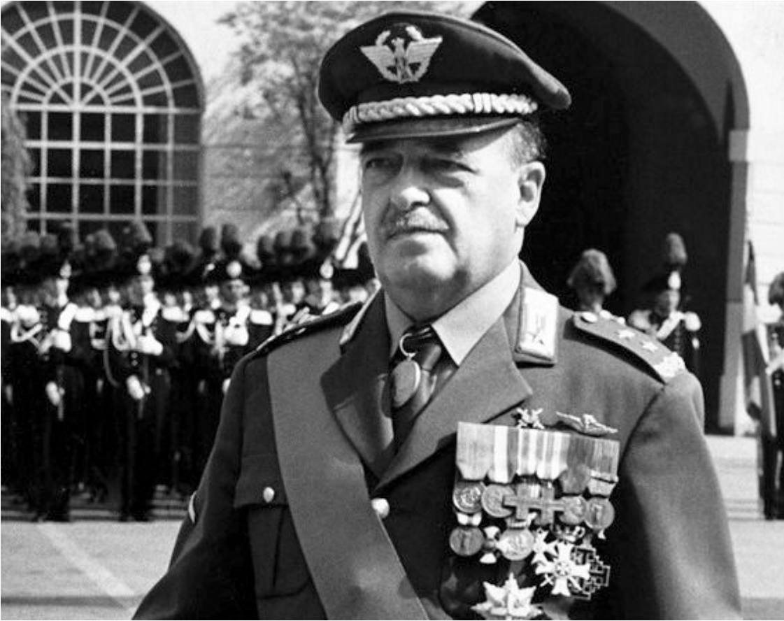
23. Il generale Carlo Alberto Dalla Chiesa, vittima di mafia.