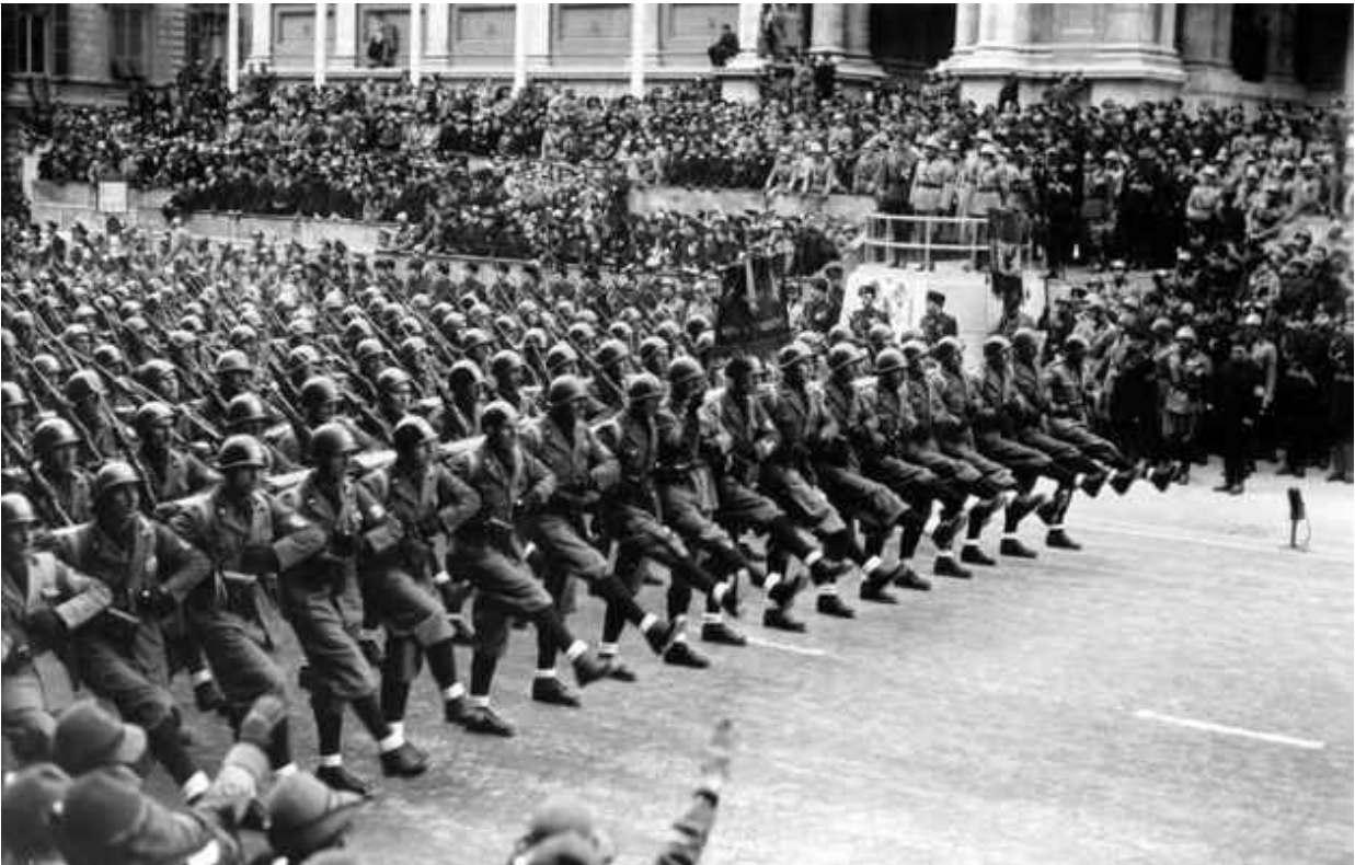
17. Sfila davanti al duce la 180 ma legione CCNN Duca A. Farnese. Roma 6 febbraio 1939.