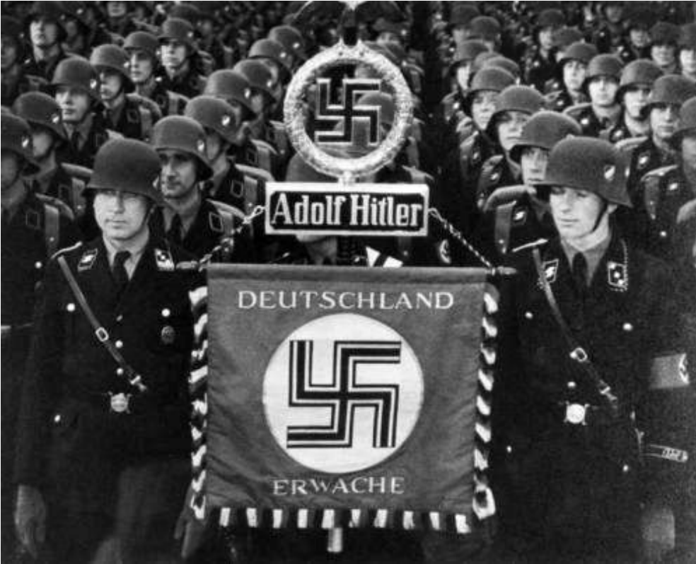
14. SS della divisione Deutschland.