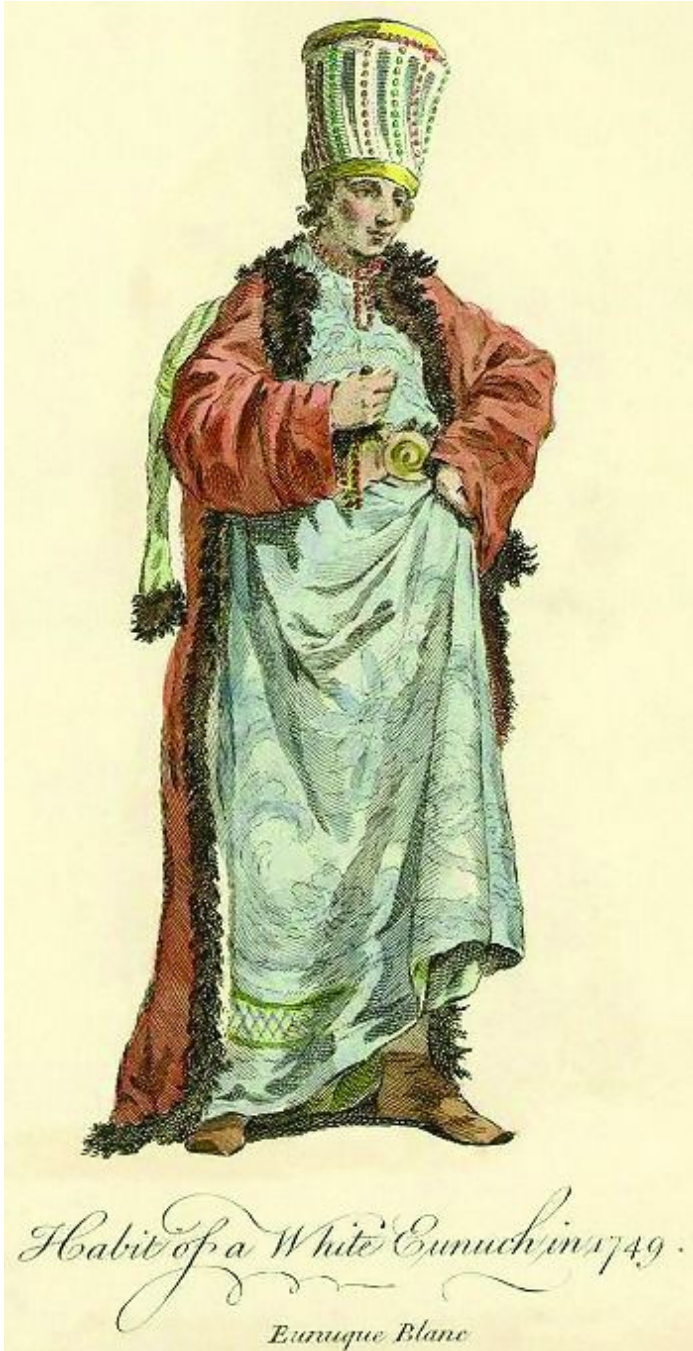
1. Eunuco bianco, impero ottomano, 1749.