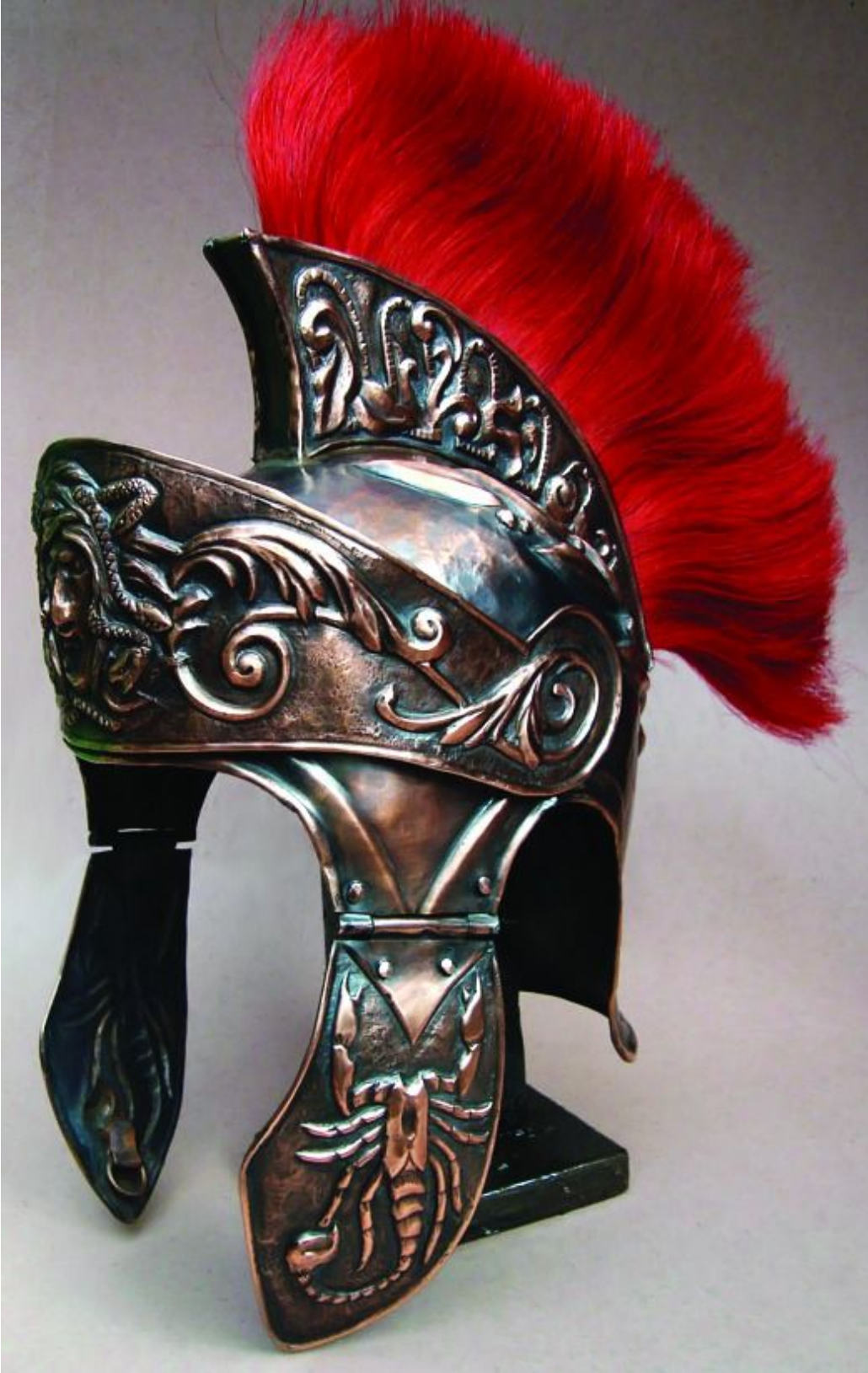
5. Elmo pretoriano da parata (riproduzione).