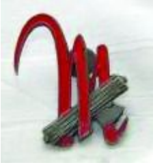
16. Mostrina «M rossa» dei Battaglioni speciali CCNN della milizia fascista.