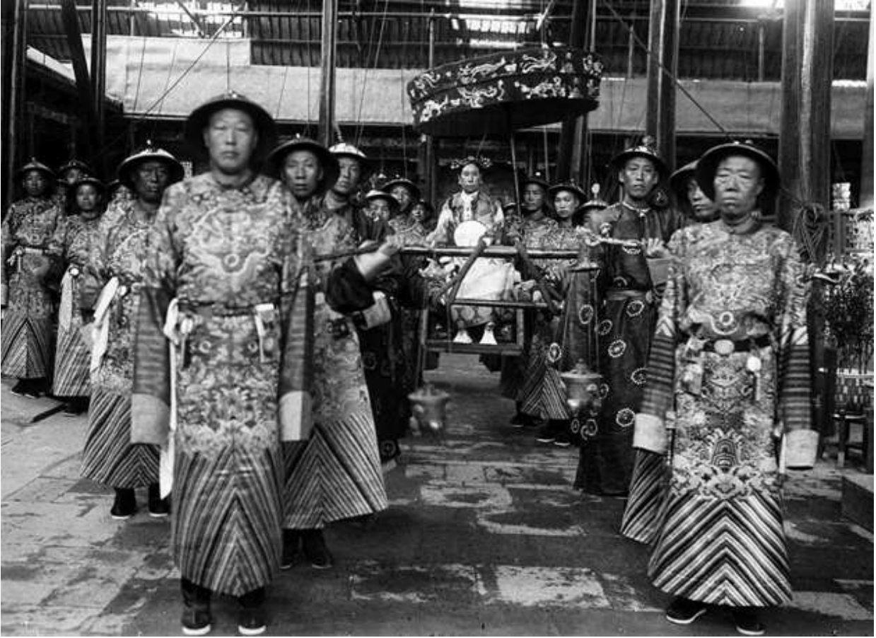
3. Corteo aperto dagli eunuchi imperiali (dinastia Qing, primi del Novecento).