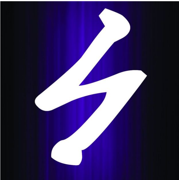
15. Lettera runica Sowilo («Forza»), uno dei simboli del nazismo.