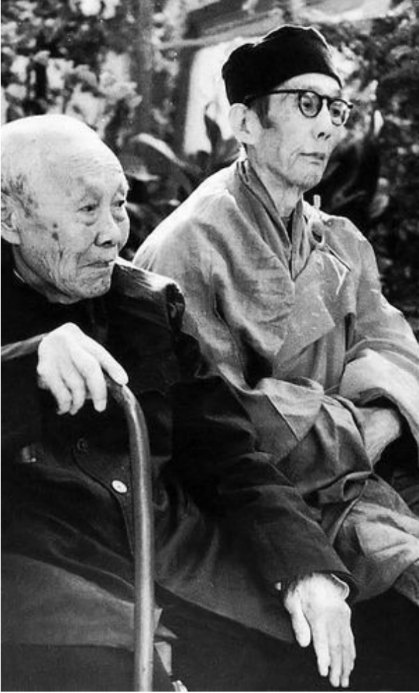
2. L'ultimo eunuco cinese Sun Yaoting (a sin.) con un monaco taoista (1995).